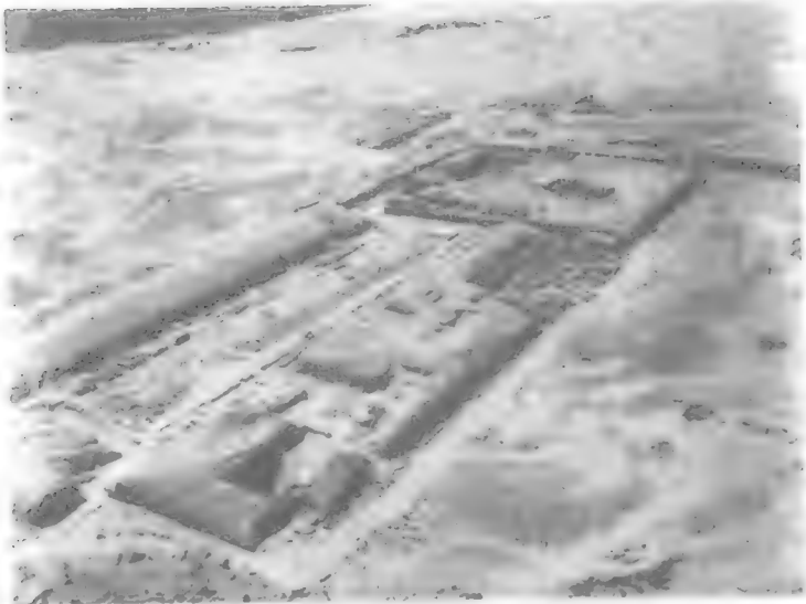
جزء من مجموعة زوسر الجنائزية